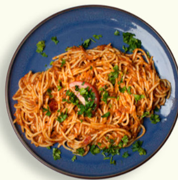
BOLOGNESE 89 Spaghetti og klassisk kødsauce med masser af smag!