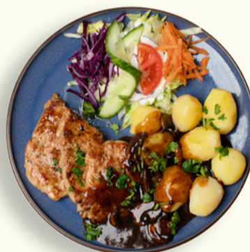
MØRBRAD 89 Svinemørbrad med kogte kartofler, salat og champignonsauce