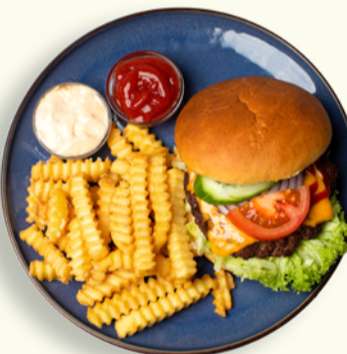
BURGER 89 I lækker briochebolle med saftig hakkebøf, cheddarost, friterede løg, sprød salat, tomat, syltet agurk og fritter