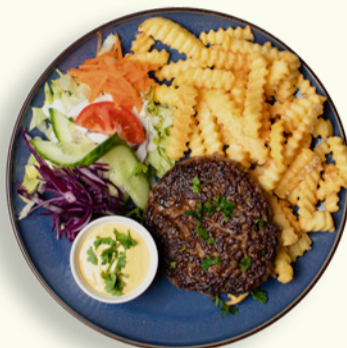
HAKKEBØF 89 Saftig hakkebøf med fritter, sprød salat og bearnaisesauce