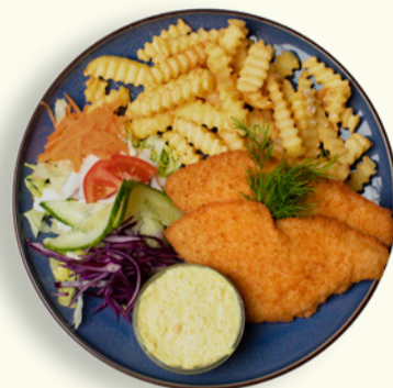
RØDSPÆTTEFILET 89 To stegte rødspættefileter med sprøde fritter, salat og remoulade