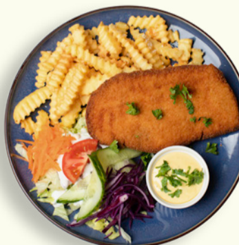
SCHNITZEL 89 Klassisk skinkeschnitzel med salat, ærter, fritter og bearnaisesauce